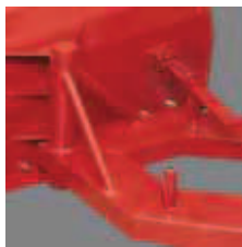
Angular adjustment Hoekverstelling Winkeleinstellung Ajuste de ángulo