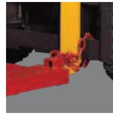
Fixing Bevestiging Befestigung Mecanismo de fijación