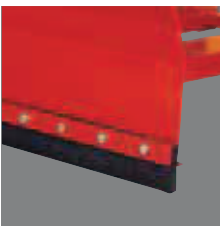
Removable scraper blades Demontabele schuiflijsten Demontierbare Schubränder Rascadores desmontables