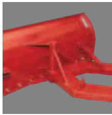
Scraper blade adjustable Schuifblad verstelbaar Verstellbarer Planierschild Hoja rascadora ajustable